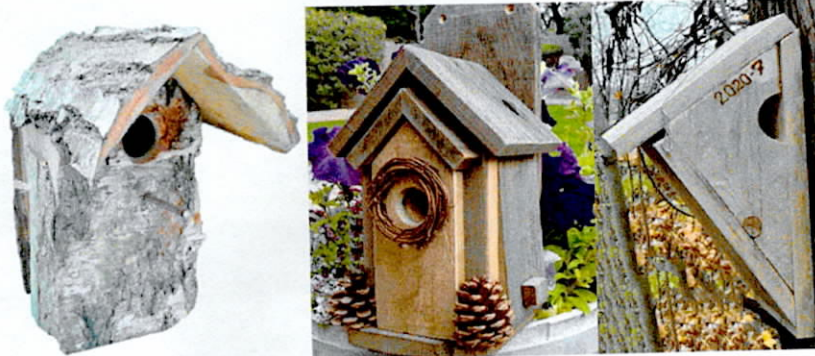
Синичник Скворечник Домик для пищухи